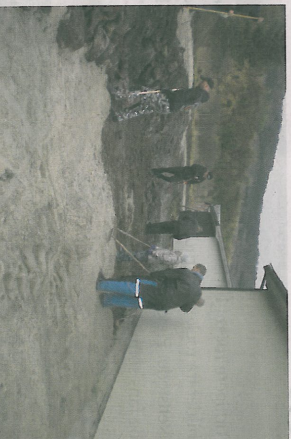
Også uteområdet har gjennomgått litt av forvandling siden Tornados MC overtok.